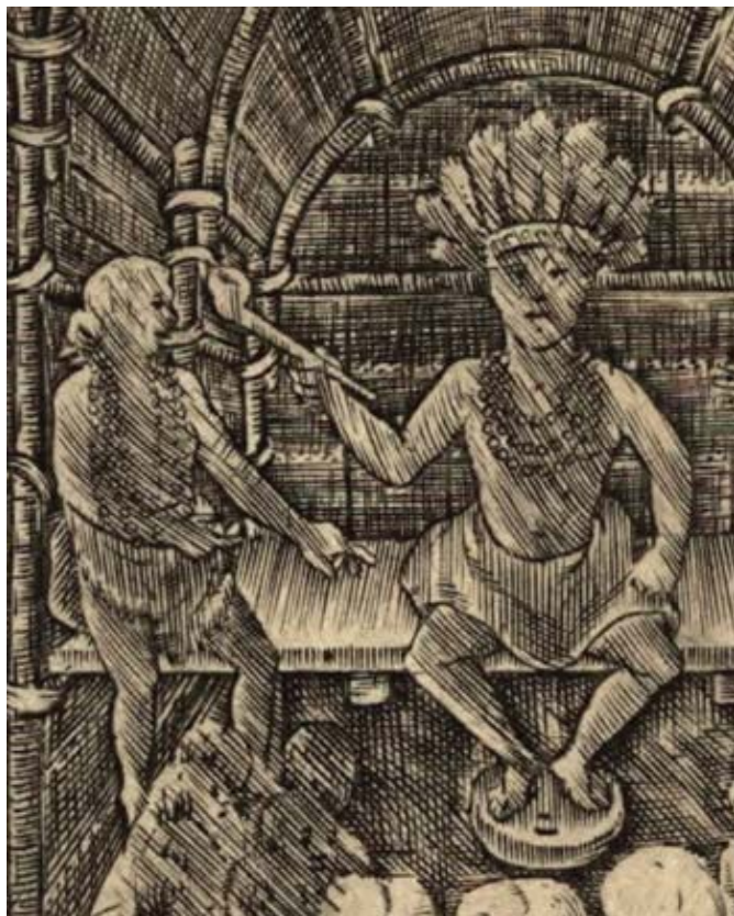
Afb. 2. Powhatan met Europees model pijp. (John Smith, Map of Virginia (detail), 1608)

In Jamestown was rond 1610 de Engelse pijpmaker Robert Cotton 6 werkzaam en in Swan Cove de eveneens uit Engeland afkomstige Emanuel Drue. De laatste was actief in de jaren 1650-1660 en vervaardigde Chesapeake type elleboogpijpen, dubbelconische modellen naar Engels voorbeeld en bijzonder gevormde hoornpijpen. 7 De laatste maakte hij naar Hollands voorbeeld. De kleur van zijn pijpen varieert van wit tot donkergrijs en zwart en van oranje tot roodbakend en bruin. Ook mengde hij verschillende kleuren om een vlammend uiterlijk te krijgen. De pijpen van Drue zijn in metalen persvormen gemaakt en hebben een strakker uiterlijk, dunnere scherf, gladder oppervlak en zijn harder gebakend dan de handgevormde pijpen. Zijn elleboogpijpen hebben uiterlijk en kwalitatief een sterke verwantschap met de pijp uit de Schermer. De elleboogpijpen van Drue hebben een gemiddelde ketelhoogte van 44mm. 8 Mogelijk werden de handgevormde pijpen op kleine schaal door Indianen en Afrikanen gemaakt en de in een vorm gemaakte pijpen met Europese technieken door de kolonisten.